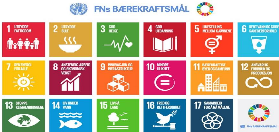
Figur 3: FN's bærekraftsmål

Det legges også til grunn at selskaper Østfold har eierandeler i så langt det er mulig skal unngå skatteparadis, eller selskaper med base i slike, blant annet ved å stille krav om utvidet land-til land-rapportering.